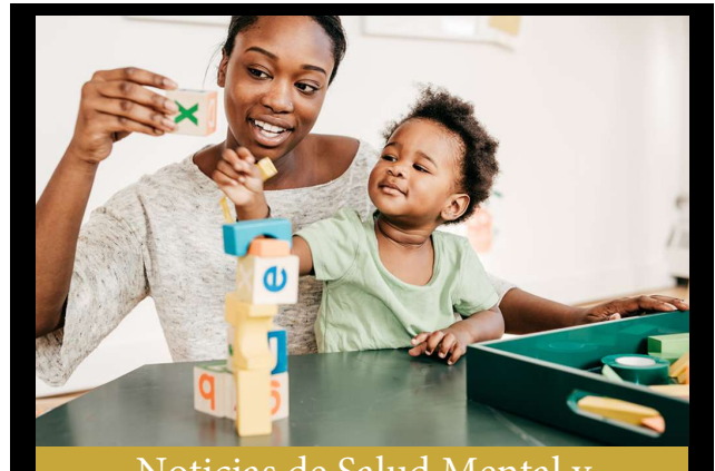
Noticias de Salud Mental y Discapacidades de Head Start

Aprender a seguir instrucciones, trabajar en equipo y turnarse es muy importante para las habilidades de preparación para el jardín de infantes. Para practicar el seguimiento de instrucciones, haga que su hijo participe en juegos como Simon Says. Para practicar el trabajo en equipo, involucre a su hijo en actividades grupales como construir una torre juntos. Por último, para practicar tomar turnos, involucre a su hijo en juegos de mesa y simplemente diga "es mi turno" cuando su hijo esté jugando. También es una gran herramienta para usar temporizadores para permitir que su hijo aprenda a tomar turnos.