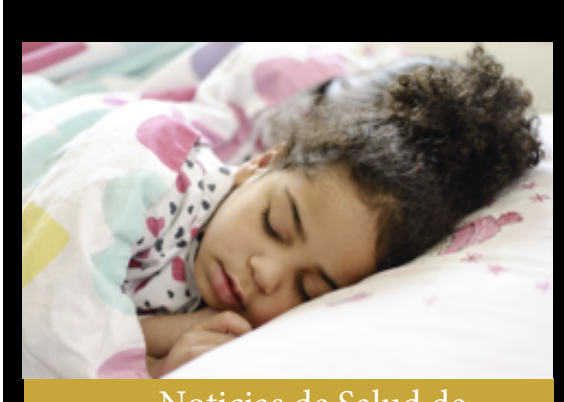
Noticias de Salud de Head Start