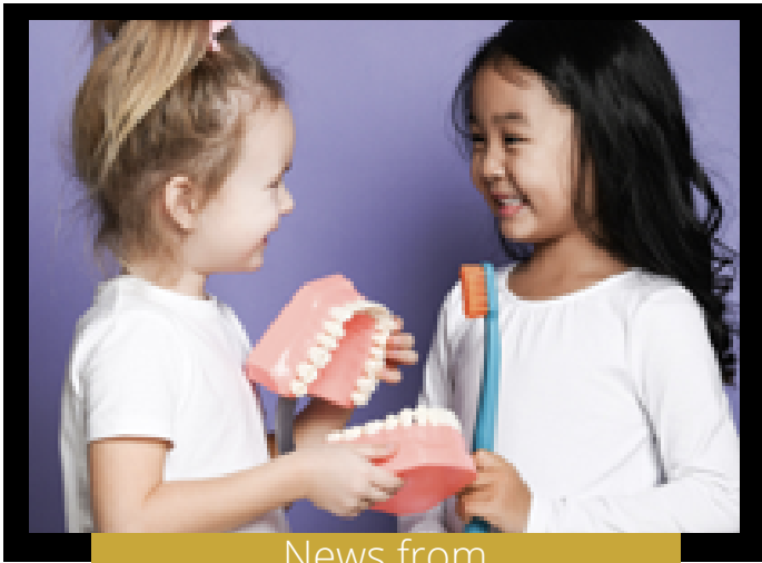
News from Head Start Health