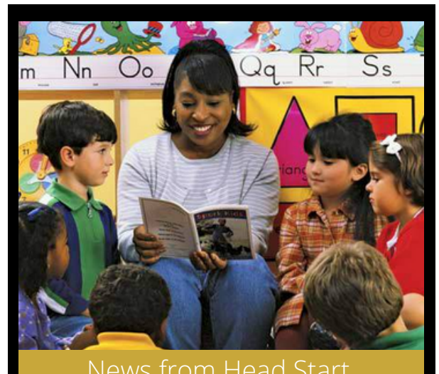
News from Head Start Mental Health and Disabilities

Children's social-emotional health is so important because it affects their overall development and learning. While having your child(ren) retell their favorite stories or while you are reading a story together, ensure that you ask how and why questions to promote their social-emotional development. Ask questions like "why do you think they are feeling that way?" "How would you help them feel better?" Questions like these enhance your child's empathy and encourage perspective-taking. Discussing books also helps children learn how to solve problems on their own and learn new vocabulary words.