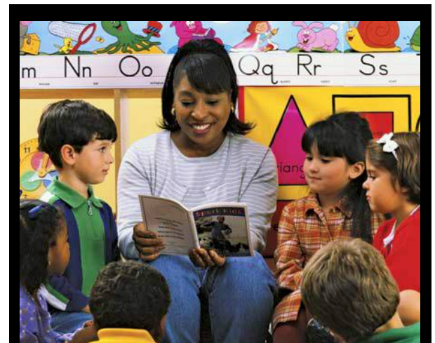
Noticias de Salud Mental y Discapacidades de Head Start

La salud socioemocional de los niños es muy importante porque afecta su desarrollo y aprendizaje en general. Mientras sus hijos vuelven a contar sus historias favoritas o mientras leen una historia juntos, asegúrese de hacer preguntas sobre cómo y por qué para promover su desarrollo socioemocional. Haga preguntas como "¿por qué cree que se sienten así?" "¿Cómo les ayudaría a sentirse mejor?" Preguntas como estas mejoran la empatía de su hijo y fomentan la toma de perspectiva. Hablar de libros también ayuda a los niños a aprender a resolver problemas por sí mismos y a aprender nuevas palabras de vocabulario.