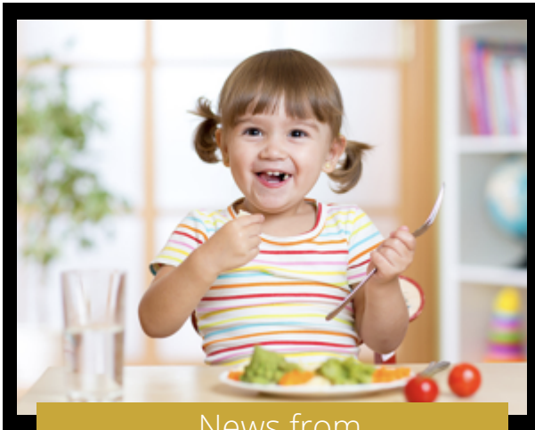
News from Head Start Health