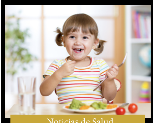
Noticias de Salud de Head Start